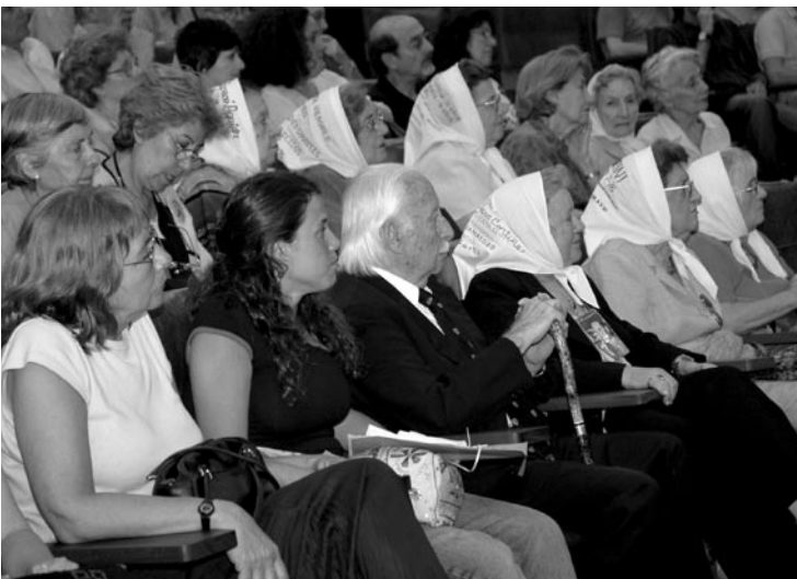
Un grupo de Madres de Plaza de Mayo (Línea Fundadora) en el acto